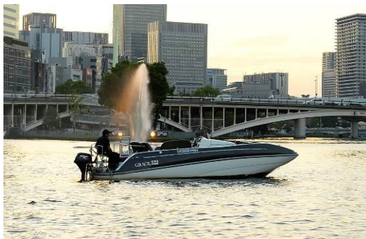
『GRACE 522』 2015年6月就航