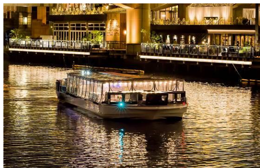
『GRACE I』 2015年4月就航