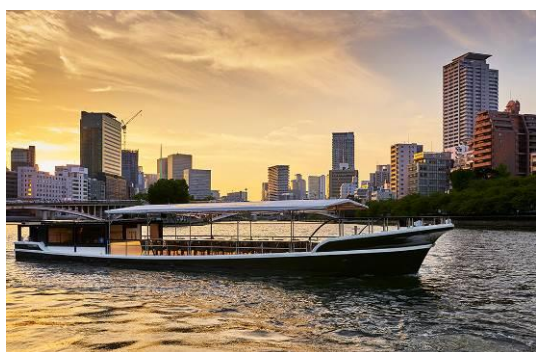
『GRACE GARDEN』 2017年9月就航